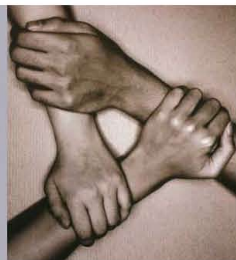
版面內容由「與愛同行」提供