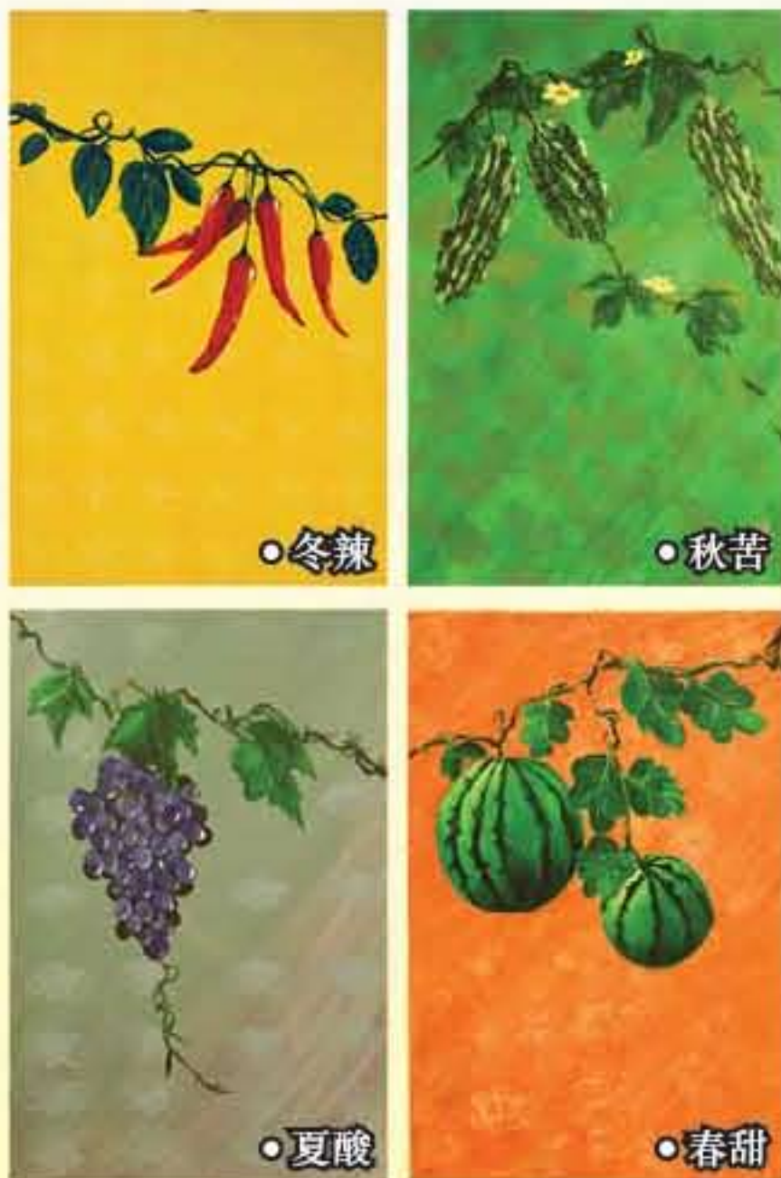
這組畫作刻意講出人們對四季的固有概念，逼進「甜酸苦辣」，喻意人生無常。