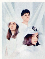
其中一個表演單位是來自法國的 Las Aves。