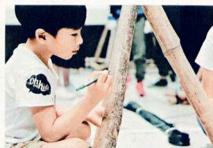
「童樂場」由小學生設計，採用竹及廢棄車軸等物料建成遊樂場設施。