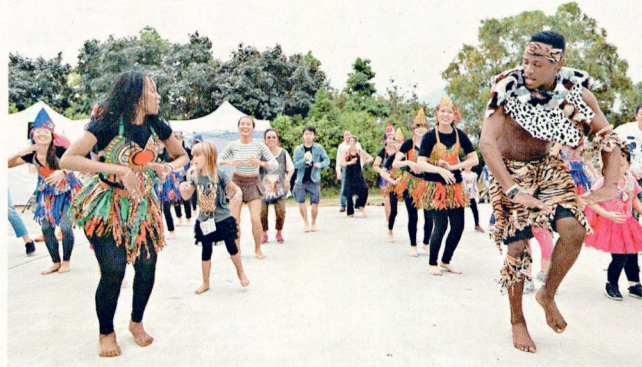
自由約有不少舞蹈活動演出。

財爺陳茂波早前在預算案有關「文化藝術」的部分開首就說：「戲曲中心上月啟用，而西九文化區其他的主要設施也會陸續竣工……」而作為首批活動的「自由約」到今天已進入第五個年頭，每年都舉辦多個活動。本季最後一次「自由約」，將在今週末一連兩日為大家預備親子、音樂、文學、市集等節目。不過，本周整天都細雨紛飛，希望周末好天啦！