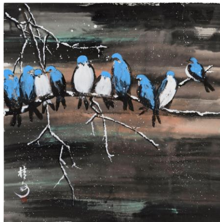
畫作二. 雪夜鳥歸林