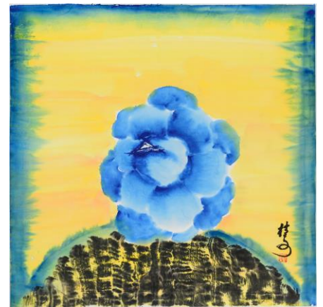
畫作三. 玫瑰 Rose

4 th Floor, Causeway Bay Community Centre, 7 Fook Yum Road, Causeway Bay, Hong Kong 香港銅鑼灣福蔭道七號銅鑼灣社區中心四樓 Tel: (852) 2855 9548 Fax: (852) 2872 5246 Email: ada@adahk.org.hk Web: http://www.adahk.org.hk