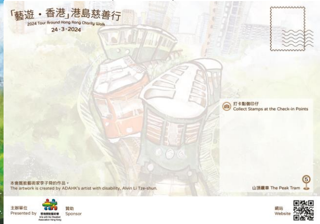
參加者獲贈展能藝術家作品明信片「打卡」。(李子舜作品)