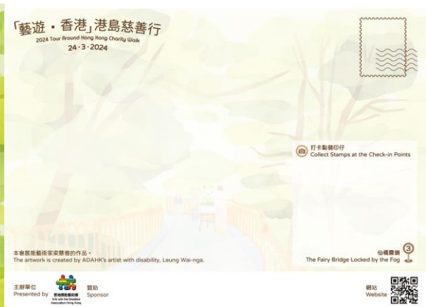
展能藝術家以不同創作形式記錄山頂之美景。(梁慧雅作品)

4 th Floor, Causeway Bay Community Centre, 7 Fook Yum Road, Causeway Bay, Hong Kong 香港銅鑼灣福蔭道七號銅鑼灣社區中心四樓 Tel: (852) 2855 9548 Fax: (852) 2872 5246 Email: ada@adahk.org.hk Web: http://www.adahk.org.hk